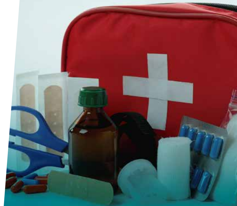
Figura 2. Debes tener un maletín de emergencias.