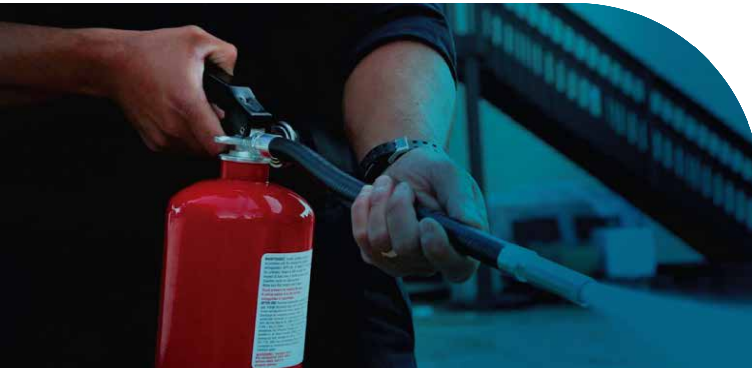
Figura 4. En casa, lo más recomendable es utilizar un extintor que sirva para extinguir fuegos de tipo A.