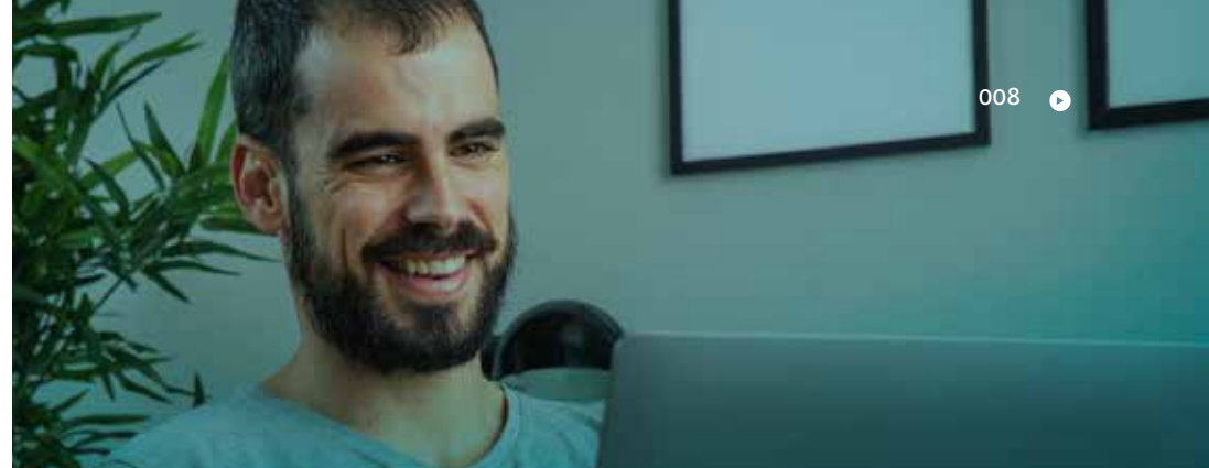
Figura 1. Es vital conocer el lugar donde vives y trabajas