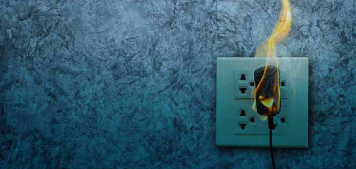
Figura 3. Las principales causas de incendio en el ámbito doméstico pueden ser: sistema eléctrico, estufas, velas, chimeneas y productos inflamables.