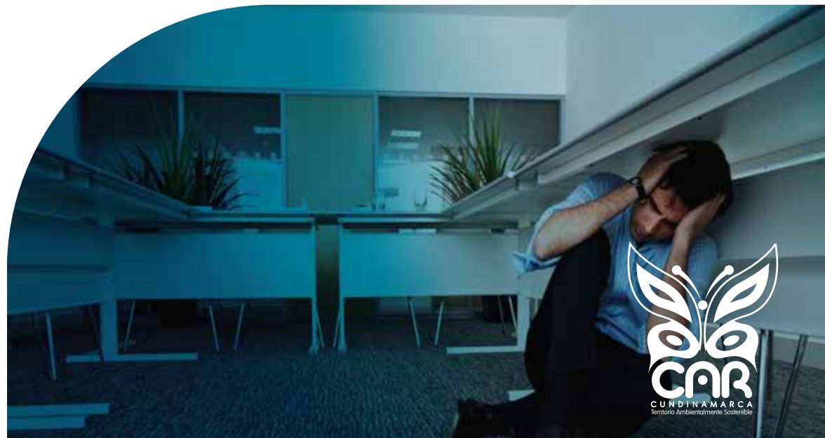
Figura 5. Nunca se evacuará durante el sismo.

Prepárate para réplicas que pueden ocurrir posterior al sismo.